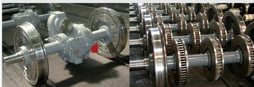
Laufachse mit Bremsscheiben